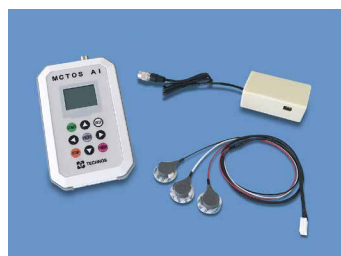
「MCTOS Model FX」

離床センサーのパイオニア「テクノスジャパン」ですが、世界に先駆けて製品化したコミュニケーション機器が在ります。その名も「MCTOS (マクトス)」。 「MCTOS」は、重度障害者のための意思伝達装置で、指の動きや瞬きも難しくなった障害者が、家族や介護の人とのコミュニケーションをとる手段として、身体の動きに頼らない生体信号(筋電・眼電・脳波)を利用する「バイオスイッチ」を開発し、製品化しました。(1999年)