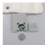
送信器の裏蓋を開け電池を取り出す。