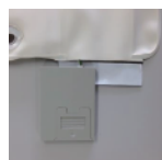
ポケットより送信器をゆっくり引き出す。