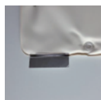
送信器ポケットのシールを開く。