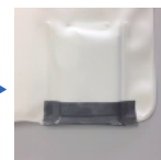
送信器のフタがある方を下に向け収納しシールを元通りに閉じる。