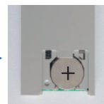
電池 OR2032(市販品の向き)に注意して入れる。