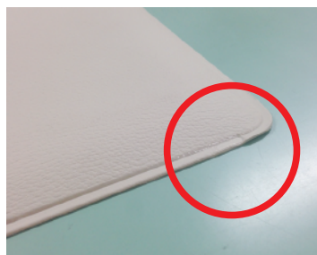
正しく敷いた状態 (センサーと設置面に隙間がない)