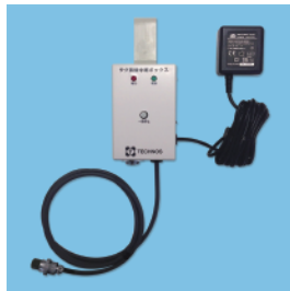
タグ無線中継ボックス

「離床コール」は、対象者（患者）に「タグ」を取り付け、ベッド周りに設置したタグ無線中継ボックスから一定距離を離れるとナースコールに報知します。「タグ」は足首または手首に取付けますが、対象者は自分で外す事ができません。床敷きセンサーを避けてしまう対象者やベッドを離れた事を知りたい場面で有効です！！