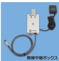
無線中継ボックス