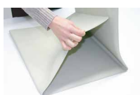
折り曲げ位置で折りたたみコンパクトに収納！