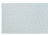
シボ加工ですべりにくく安全に！