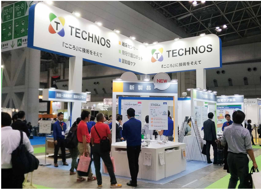
解放感があるテクノスジャパンのブースです

今年は、解放感であふれたブース！スタッフ全員がさわやかな気持ちで、たくさんの来場者をお迎えすることができました。ブースでは、離床センサーの新製品をはじめ、在宅ケア製品を展示。また、中央に設けたステージでは製品デモンストレーションを行い、大盛況の中終了いたしました。