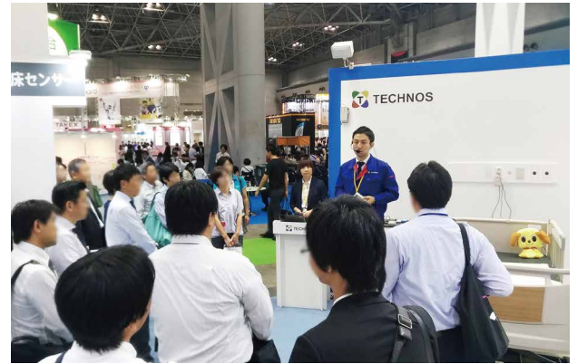
ブース中央では製品のデモンストレーションを随時行っています