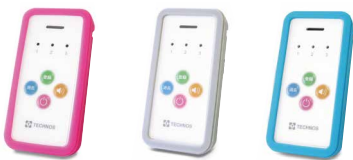
カラーは3色よりお選びいただけます

簡易型受信器「シンプル」は、操作や機能を最小限にまとめた、誰でもかんたんに使える受信器です！ポップで目を引くデザインで会場でも、大変好評をいただきました。「シンプル」は次号で詳しくご紹介いたします！