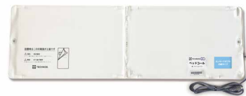
センサーアダプタが ベッドセンサーに内蔵されました

BC-1からのリニューアル！センサーアダプタが不要になり、部材がひとつ減りました。これにより、ベッド周りがスッキリ！価格もお求めやすくなりました。