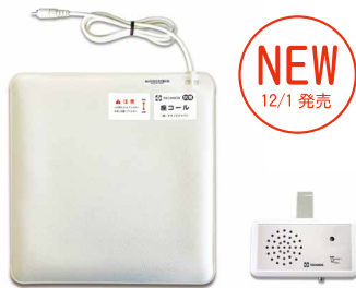
座コール・メロディタイプ (ZC-2)

報知方法は、「1. その場でメロディが鳴る」、「2. 離れた場所で受信器が鳴る」の2パターンあります。