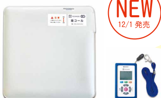
座コール・スマート (ZCSM-2)