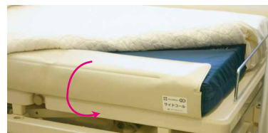
マットレスに巻き付けて設置