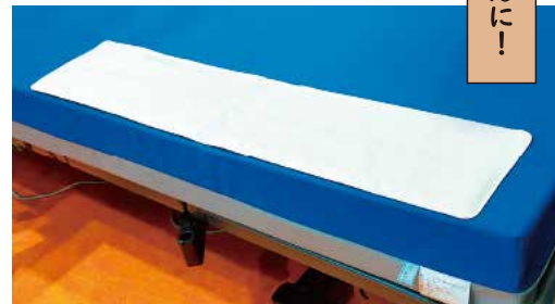
新センサーはマットレスに置くだけで設置完了！