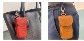
かばんに取り付け