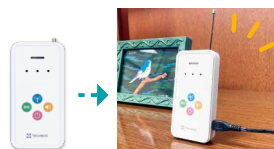
おでかけレシーバーは 屋内に設置