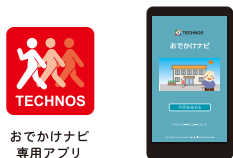
おでかけナビ 専用アプリ