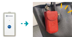
おでかけタグは カバン等に取り付け (専用ケースが付きます)