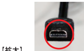
【拡大】 充電プラグの形状