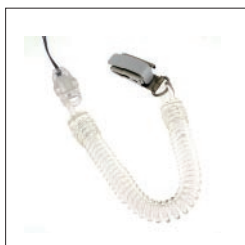
落下防止クリップ付ストラップ

落下の衝撃より内部基板の損傷、スピーカーの故障が考えられます。外部の破損がなくても、落下の衝撃は内部の様々な箇所の故障に繋がります。