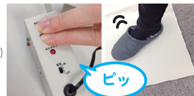
ボタンを押しながらセンサーを動作させる。