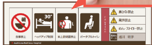
ベッドサイドにマグネット式のピクトグラムを貼り付ける

「医療看護支援ピクトグラム」は、患者・家族とのコミュニケーションツール(道具)として活用します。沢山の種類があり、日常生活動作や治療上の制限などを貼付し、患者の状態や移動方法が変化した時に、速やかに貼替えます。