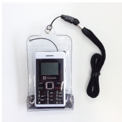
「防滴ケース」装着イメージ

※2014年9月より、ポケット受信器専用「防滴ケース」をオプション品(有償)でご準備しています。 価格のお問い合わせやご要望の際は、ポケット受信器購入の販売店様までおたずねください。