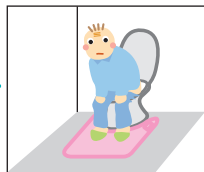
【便座に座る】 センサーにかかる荷重が少なくなる ※1秒以内の腰を浮かす動作は報知しません