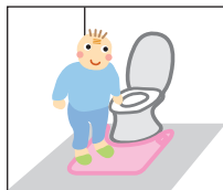
【マットを踏む】 センサーに荷重がかかる