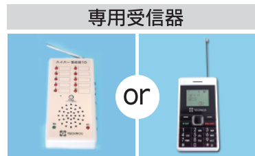
専用受信器 ハイパー受信器10 (固定型) or ポケット受信器 (携帯型)