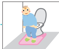
【便座から腰を浮かす】 センサーに再び荷重がかかる (1秒以上)