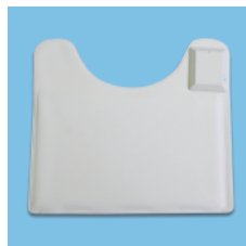
マット・トイレセンサー