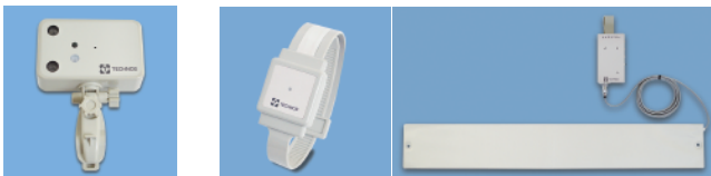
「超音波・赤外線センサー」