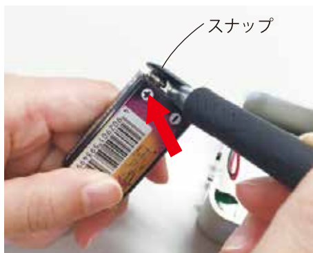
①スナップの間にペン先・定規等を差込む

A 定規やボールペン(樹脂製)などで簡単に取り外すことができます。 下記を参考に電池交換を行ってください。