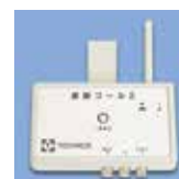
コンソール 10 コンソール