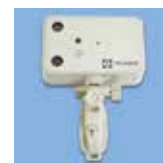
超音波・赤外線センサー 赤外線センサー