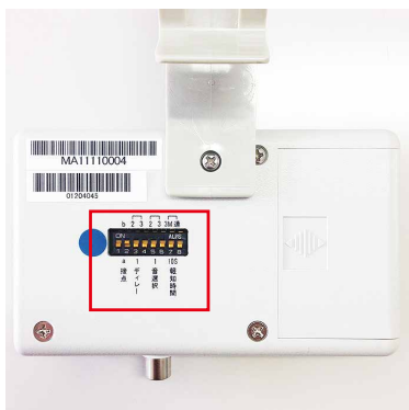
マルチアラーム裏面スイッチ部

接点入力設定が b 接点(上)になっていないと、本来の正しいタイミングで報知しません。