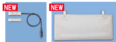
「ドアコール」 「パネコール」