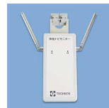
徘徊ナビモニター