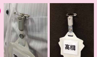
クリップで取り付け 安全ピンで取り付け

名札タグの取り付け・取り外しは「クリップ」「ピン」でワンタッチ! 「名札」と兼用のため、タグ装着の違和感を解消できます!