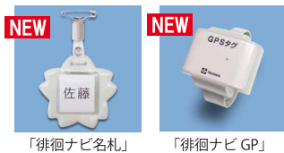
「徘徊ナビ名札」 「徘徊ナビ GP」

押せない人も使えるナースコール「パネコール」、徘徊しても居場所がわかる「徘徊ナビ GP」、そして、徘徊・離室を報知する「ドアコール」が新しくなり「家族コール」や「ケアロボコール」Dタイプとしてラインナップに加わります!