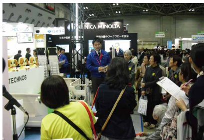
毎年好評の特設ステージです!

今年のテクノスジャパンのブースは、例年のやわらかい雰囲気を一変しイメージカラーのコバルトブルーを基調にした、見通しの良いブースで、たくさんの来場者をお迎えすることができました。恒例の特設ステージでは、「介護保険レンタル」「在宅ケア」「離床センサー」をテーマにご紹介し、常に人が溢れかえるにぎやかなステージとなりました。