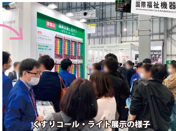
くすりコール・ライト展示の様子