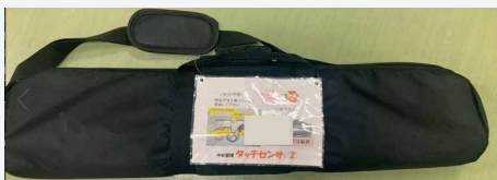
カメラの三脚ケース