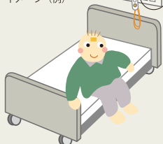
ベッドまわり イメージ（例）

「 オプション入力コード 」が必要かは、まずは「 オプション入力コンセント 」が お部屋にあるかどうかによって判断します。下記イラストをご参照ください。